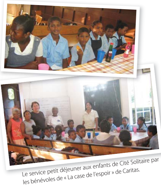
Le service petit déjeuner aux enfants de Cité Solitaire par les bénévoles de « La case de l'espoir » de Caritas.

Consolidated Fabrics Ltd (CFL) quant à elle, soutien le projet « La case de l'espoir » de Caritas à Solitude en finançant le petit déjeuner quotidien d'une vingtaine d'enfants issus de milieux défavorisés.