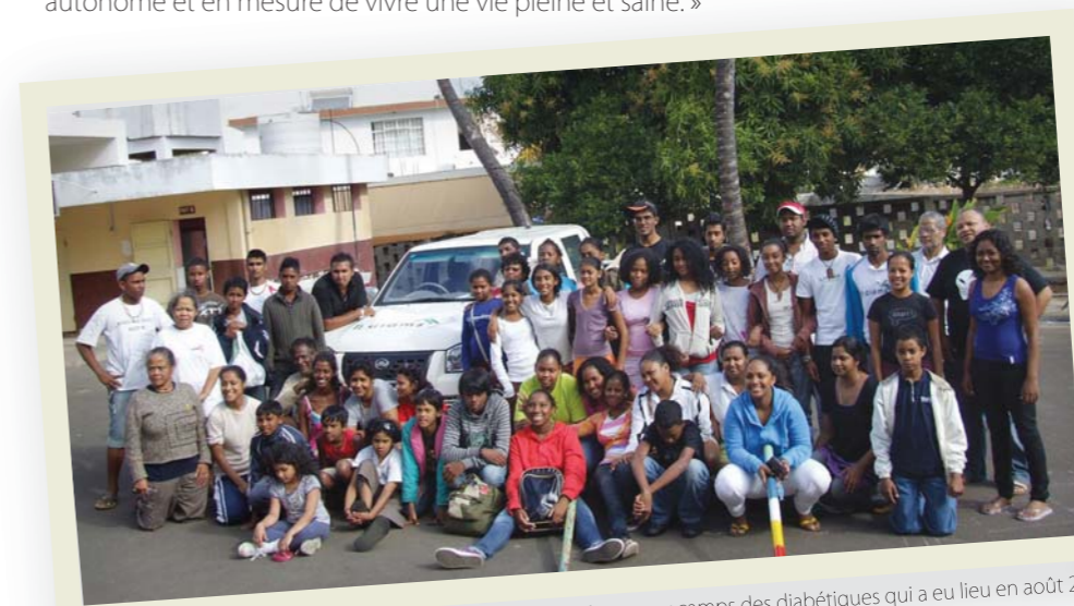
Les membres de T1 Diams et leurs encadrants aux camps des diabétiques qui a eu lieu en août 2010.